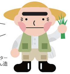
和歌山移住応援キャラクター ほんまもん造